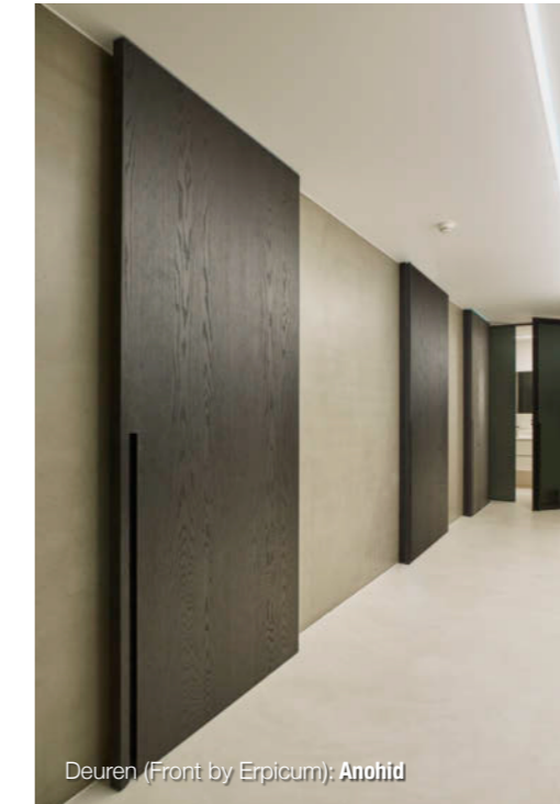
Deuren (Front by Epicum): Anohid