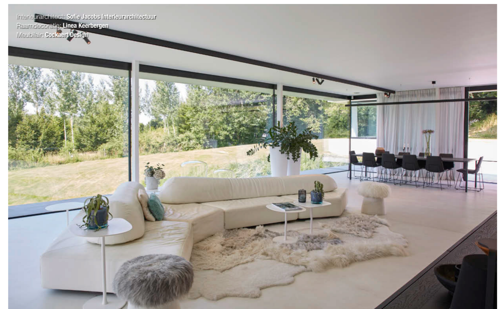
Interieurarchitect: Sofie Jacobs Interieurarchitectuur Raamdecoratie: Linea Keerbergen Meubilair: Cockaert Design

De praktijk met annex badkamer, de traphal naar de onderste bouwlaag en het bezoekerstoilet zijn af te sluiten door innovatieve schilderdeuren op maat, met onzichtbaar pivot- of schuifdeurbeslag.