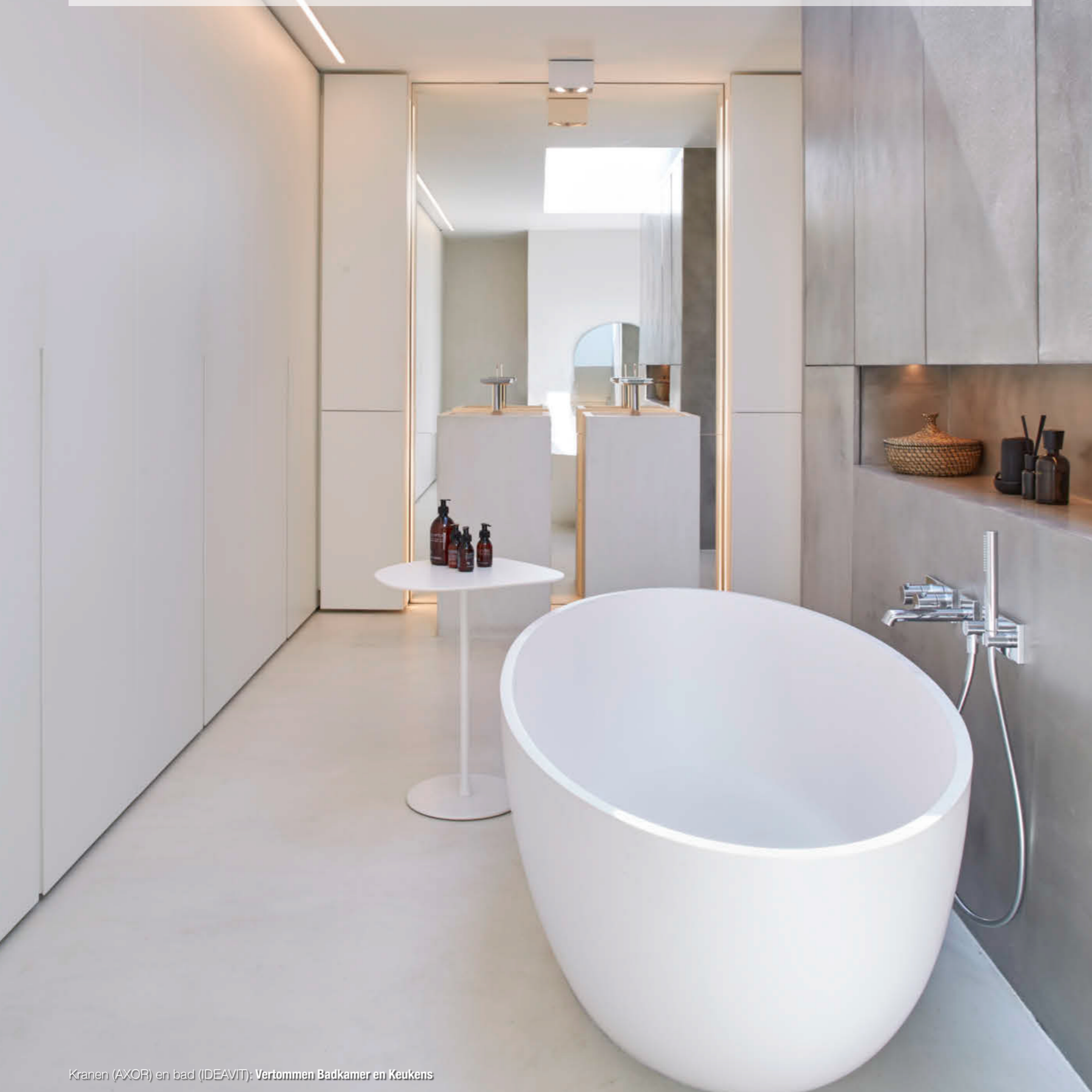
Kranen (AXOR) en bad (IDEAVIT); Vertommen Badkamer en Keukens